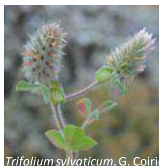
Trifolium sylvaticum , G. Coirié

Si vous désirez en savoir plus sur le LIFE+ Desman, rendez-vous sur www.desman-life.fr , il y a aussi la page Facebook www.facebook.com/desmanlife .