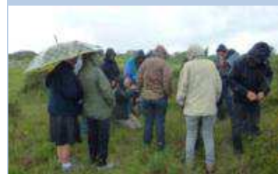
Le millepertuis sous la pluie, F. Arabia

Ce projet se poursuit avec une sensibilisation des propriétaires et usagers de parcelles abritant des espèces très rares. Ça a été le cas avec le Millepertuis perfolié à Boutenac, où nous avons fait une sortie botanique avec la propriétaire et une vingtaine de personnes... sous la pluie. Merci aux courageux.