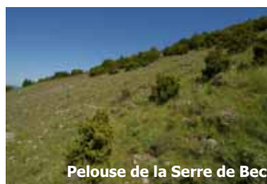
Pelouse de la Serre de Bec

Après avoir dépassé le défilé de la Pierre-Lys, l'Aude calme sa course et traverse le territoire de Quillan . Ces gorges sont typiques des milieux de falaises attractifs pour les chauve-souris et l'avifaune nicheuse. Les milieux forestiers dominent, avec, selon les conditions, la chênaie pubescente, verte ou la hêtraie. On rencontre sur les pentes et les sommets des pelouses , dont certaines sont riches en orchidées, et non loin des villages, des prairies de fauche .