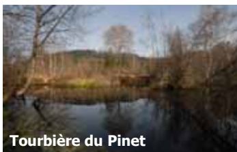
Tourbière du Pinet

Plus loin, l'Aude reçoit les eaux du Rébenty dont la vallée traverse le Plateau de Sault . Bordées par une ripisylve d'aulnes et de frênes, ses eaux accueillent la truite fario et le desman. Occupé en majorité par une forêt de hêtraie sapinière où vivent le cerf et la chouette de Tengmalm, ce territoire renferme des espaces voués aux cultures où l'on trouve des mesicoles comme le bleuet. Le karst du Plateau de Sault, à l'origine des grottes et gouffres , permet la présence par endroits de tourbières et de prairies humides où vit la grenouille rousse.