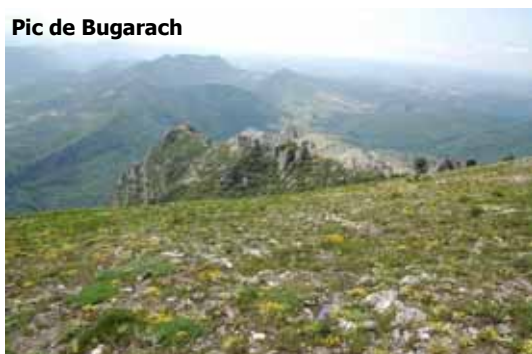
Pic de Bugarach

Les sommets ventés à sol peu profond sont occupés par des pelouses rases que l'on retrouve dans les Corbières et les zones chaudes pyrénéennes. Souvent peu denses, elles sont composées de plantes aux fleurs colorées comme les hélianthèmes ou l'androsace des Alpes, parfois accompagnées de buis et de genévrier. Le sommet du Pic de Bugarach en est un très bel exemple.