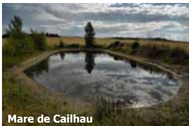
Mare de Cailhau

À la sortie de Limoux, l'Aude reçoit en rive gauche les eaux du Sou qui, après avoir traversé tour à tour des paysages de collines, de bois, de champs et de vignes, finit là son parcours à travers le Razès . Ce territoire est occupé en majorité par des vignes et des cultures où l'on peut trouver des plantes adventices comme le diplotaxis fausse roquette. Une forêt de chênes pubescents, dans laquelle chante le pinson des arbres, est répartie sous forme de bois dans le territoire. Les mares et les plans d'eau sont des lieux essentiels à la reproduction des amphibiens