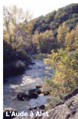
L'Aude à Alet

C'est après avoir franchi les gorges d'Alet que l'Aude rejoint le Limouxin . Calme et large, elle accueille le vairon et le chevesne. Le paysage est marqué par la présence de la vigne où l'on peut rencontrer des insectes comme l'empuse. Les haies qui bordent les parcelles sont riches en arbustes dont les baies attirent les oiseaux. Des milieux forestiers composés de chênaies pubescentes et vertes sont présents par endroits, ainsi que des pelousses au sein desquelles les petits points d'eau sont fréquentés par la rainette méridionale.