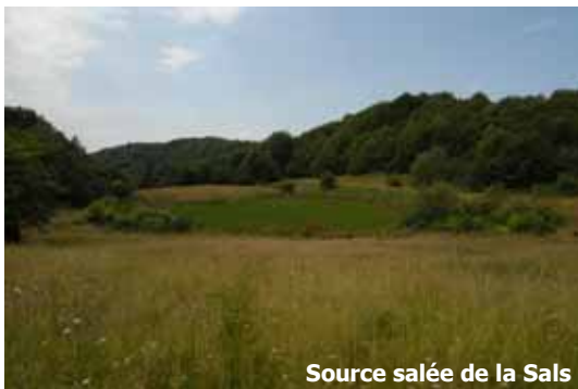
Source salée de la Sals

Il est caractérisé par des reliefs variés : vallées, collines, plateaux et versants sont dominés par le Pech de Bugarach qui culmine à 1231 m d'altitude.