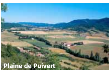
Plaine de Puivert

À l'ouest, le Chalabrais est parcouru par l' Hers qui se jette dans l'Ariège : nous sommes sur le versant atlantique. Ce territoire vallonné est occupé en majorité par des milieux forestiers composés de chênaies, hêtraies et forêts de résineux qui accueillent le cerf, le sanglier et le pic noir. Les prairies de fauche , à la diversité végétale importante, sont riches en papillons.